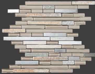
SAND ZHP1 Malla 30 X 30 cm.