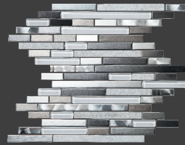
IRON ZHP3 Malla 30 X 30 cm.