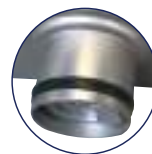
Empaque de ajuste