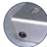
Tapón de ajuste perfecto